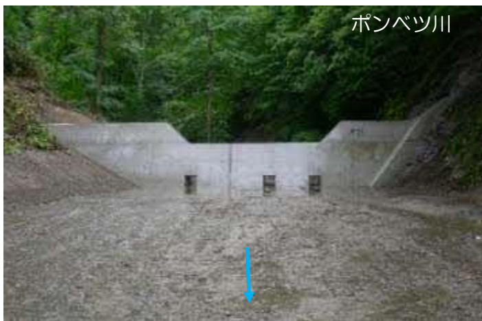
国有林内における治山ダムの整備 （胆振東部森林管理署）