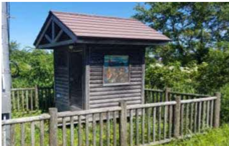
（白老川）水位観測データの提供