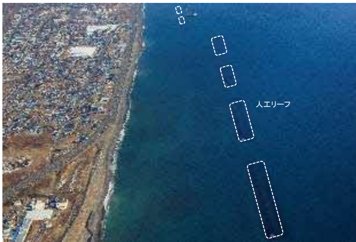
（胆振海岸）人工リーフの整備

まちづくり等での活用を視野にした多段的な浸水リスク情報の検討 （胆振総合振興局）