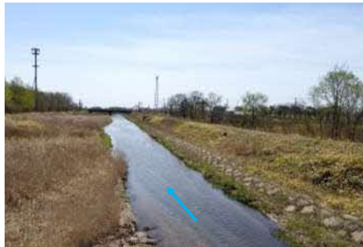
（ブウベツ川）河道掘削等の実施