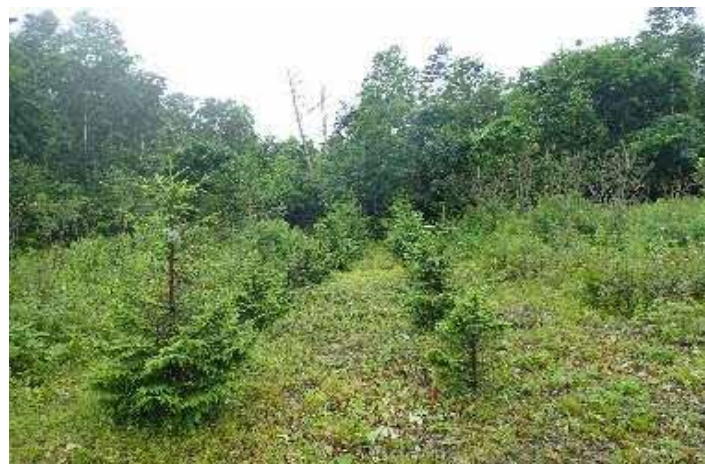
国有林内における植栽の実施 （胆振東部森林管理署）