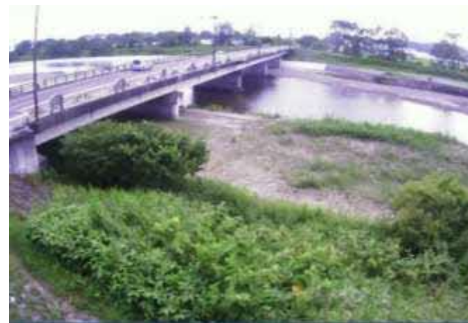
（白老川）簡易型河川監視カメラによる映像提供