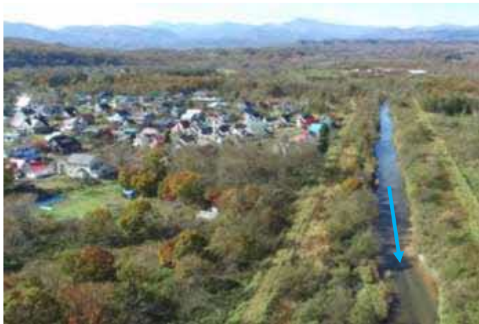
（ウヨロ川）河道掘削等の実施