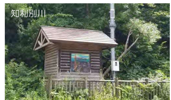
水位観測データの提供(胆振総合振興局)