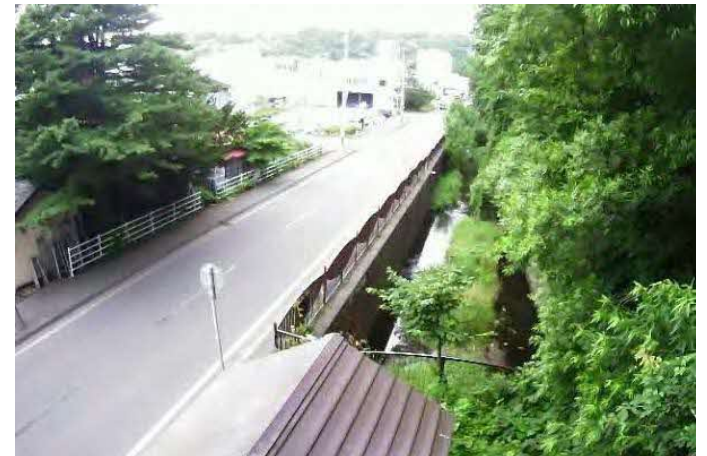
（知利別川）簡易型河川監視カメラによる映像提供