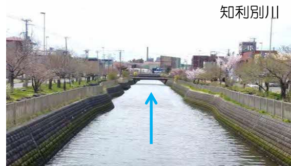
河道掘削等(胆振総合振興局)