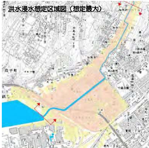
まちづくりでの活用を視野にした多段的な浸水リスク情報の検討 （胆振総合振興局）

想定最大規模や計画規模のみならず、より高頻度で発生する降雨規模での洪水氾濫区域を検討する