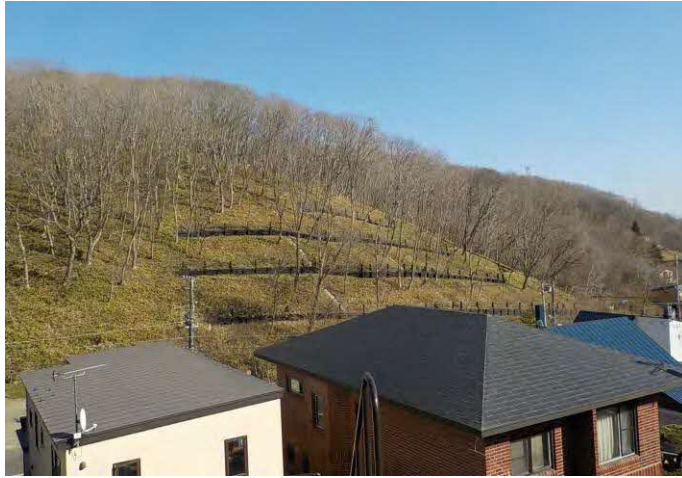
（室蘭中島本町3丁目4）急傾斜地崩壊防止施設の整備