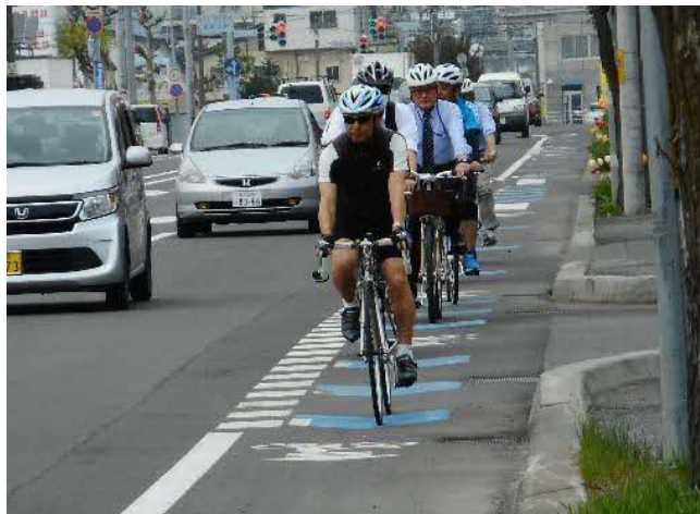
H29試験施工箇所について実走による検証