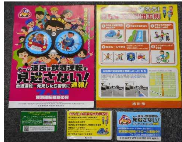
H30：チラシ配布による啓蒙活動