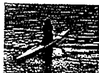
JOC エリートアカデミーに入校し、海外遠征などに参加

J-STAR 修了後、有望選手は、各中央競技団体の強化・育成コースに進出。オリンピック、パラリンピックをはじめ、世界で活躍できるトップアスリートを目指すために引き続きトレーニングを重ねていく機会が得られます。