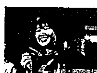
全日本選手権大会で、日本記録を樹立