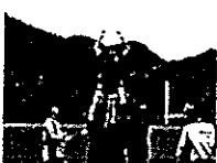
競技団体のユース選抜や育成・強化選手に選出