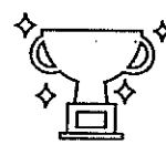
4名が東京2020パラリンピック競技大会出場