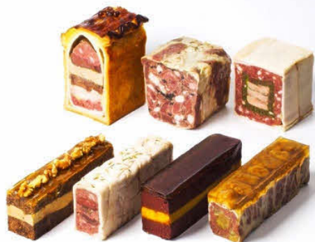
狩猟による生産食肉加工製品：テーリーヌ