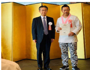
令和元年度 農林水産省料理人顕彰制度 料理マスタース受賞式