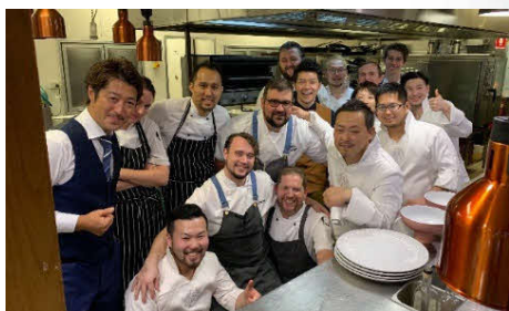
オーストラリア クイーンズランド州でのイベント風景