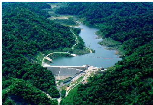
上小川ダム(苦前町) 平成15年完成