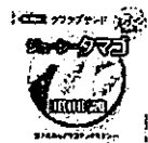
ジューシータマゴ