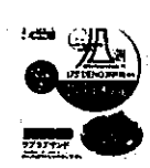
175° DENO 担担麺風