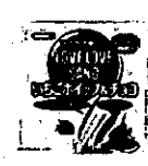
いちごホイップ&チョコ