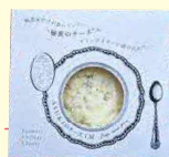
「秘密のチーズ」 ASUKAのチーズ工房(むかわ町)