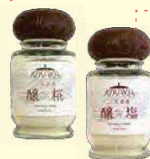
「醸塩」「醸塩」 小坂農園(むかわ町)