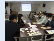
＜SDGsセミナーin道東(北見市)＞