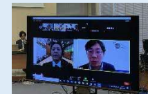
＜SDGs×北海道交流セミナー2021＞ (オンライン)