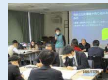
＜厚真町での職員向け研修＞