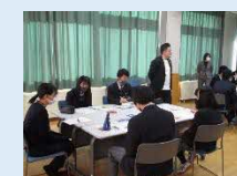
＜標茶町での高校生向け研修＞