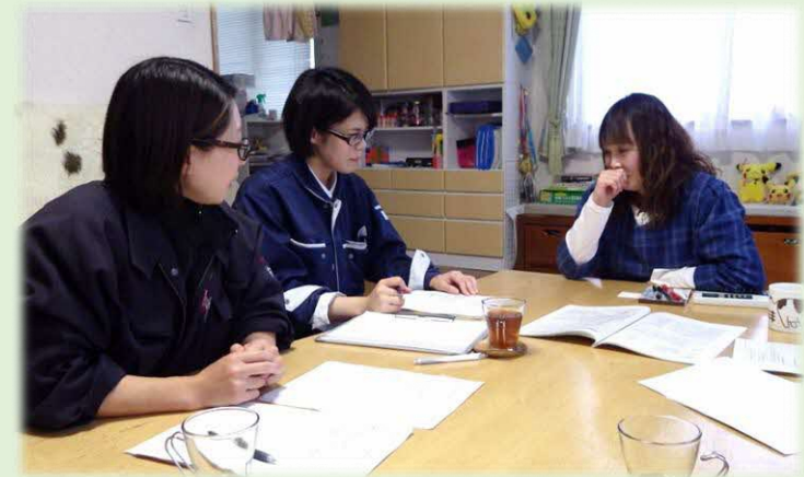
実態調査、報告・情報交換