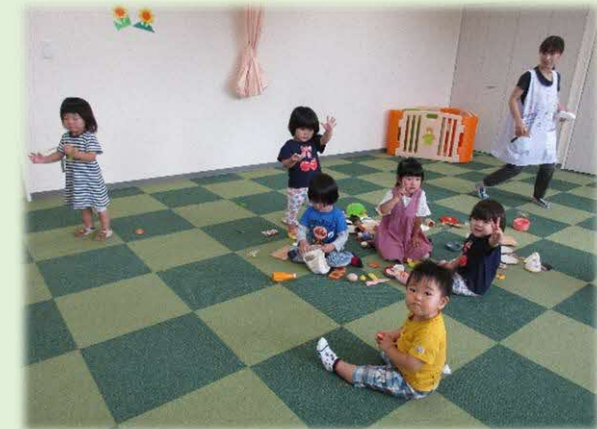
「えみふる」内 託児室