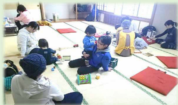
親子サロンの様子（農協和室）