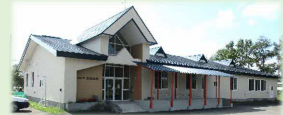
計根別こども館「えみふる」