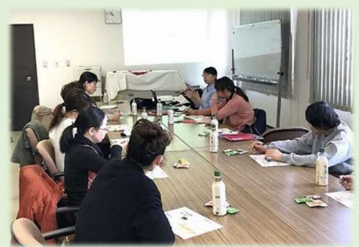
女性学習会「つくし学級」