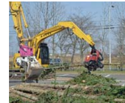
▲高性能林業機械を稼働実演

釧路市で森林・林業に関する大型イベントを開催。釧路管内を中心に28の団体・企業が参加、木工作や展示、木育など36のイベント・ブースを運営し、2日間で約2,300名の来場者を数えました。