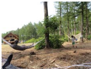
▲原野のもり(ハンモックからの全景)