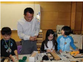
▲根室市春国俗原生野鳥公園ネイチャーセンターまつりでの木工体験（マイ箸づくりほか）

根室市では木育を推進するため①触れる活動②創る活動③知る活動に分けた様々な木育活動を展開。平成26年度も市内の小学生を対象に森林の大切さを伝える木育授業や木工体験、根室市春国俗原生野鳥公園ネイチャーセンターまつりでは一般市民を対象とした木工体験（マイ箸、箸置き、カスターネット、ボードコルクづくり）を実施しています。