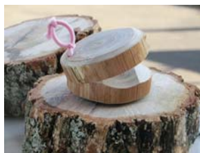
▲枝から作るカスターネットづくり