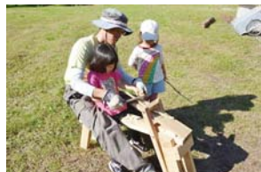
▲グリーンウッドワーク(削り馬)

弟子屈町内の私有林を活用した木育ひろばです。森のプレイパークやたき火、森のおていれ、セラピーカフェ、グリーンウッドワーク、イグルーブづくりなど、企画するメンバーや季節に合わせた様々な木育のプログラムを提供しています。