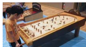
▲木製遊具「スマートボール」