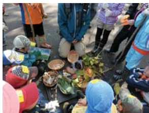
▲穴場スポットの探検