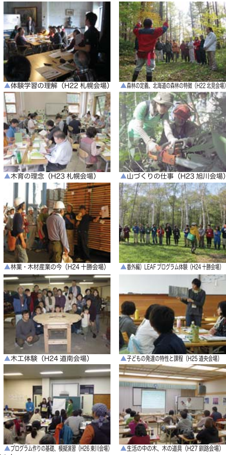
▲プログラム作りの基礎、模擬演習（H26 東川会場） ▲生活の中の木、木の道具（H27 釧路会場）

北海道では平成22年度から木育の理念を十分に理解し、木育活動の企画立案やコーディネイトができ、指導的な役割を果たす人材を育成するための研修を行っています。研修は、室内講義及び実習を前期・後期2日間ずつ計4日間行うとともに、室内講義及び実習で修得した内容を実践するためのOJT研修を実施します。この育成研修の全課程を修了した方を、北海道知事が「木育マスター」として認定しています。