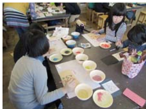
▲根室市立北斗小学校での木工体験（オガ粉アート）