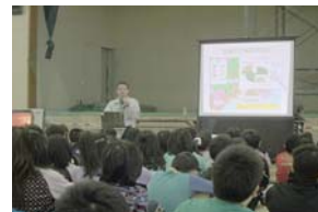
▲釧路市の森林について学ぶ