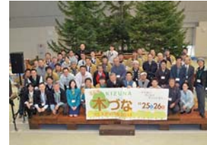
▲シンボルツリーと木製ステージ前に関係者集合