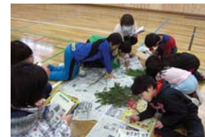
▲木の枝のワークショップ