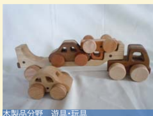
木製品分野 遊具・玩具

幼稚園児や小学生を対象とした室内専用複合遊具です。北海道産材を活用し、木の香り・堅さ・柔らかさなどの感触を感じ、安全面にも十分配慮しつつ、楽しく遊べるよう設計しています。行政や専門機関を含む異業種でプロジェクトを組み、地元の子も多くの方が関わって完成しました。施設の半分は遊具ですが、半分はギャラリーとして地元小学生の木工レリーフ作品を展示しています。この遊具には森、地域、それを育てて来た先人達を考え学んで欲しい、地域住民の憩いの場になって欲しいという願いが込められています。