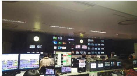
HTB를 견학하는 국제교류원과 HTB의 사내 풍경