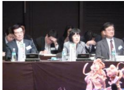
발언 중인 다카하시 지사 (사진-가운데)

한국, 일본, 중국 순으로 매년 번갈아가며 개최되는 이 회의의 다음 개최지는 홋카이도로 예정되어 있습니다.