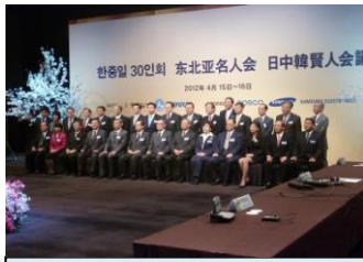
한중일 30인 회의의 참석자들