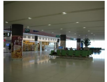
2층 입국장 대기소→ 넓고 쾌적한 공간에서 방문객을 맞이할 수 있습니다.