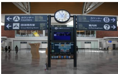
↑3층 출국장 표지판.

신치토세 공항 http://www.new-chitose-airport.jp/ko/ (한국어 홈페이지)