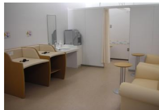
↓3층 출국장의 파우더룸 긴 비행시간의 피로를 풀며 쉬어갈 수 있는 곳입니다.