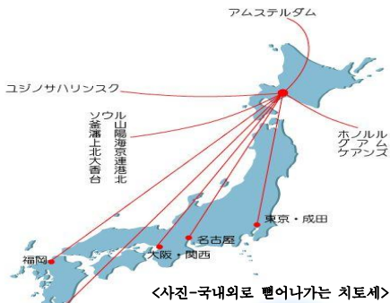
<사진-국내외로 뻗어나가는 치토세>

치토세라는 지명이 되기 전 이곳은 아이누어로 「계곡」을 뜻하는 「시코쓰」라고 불리던 곳이었습니다. 그 당시 이 지역에는 많은 학이 서식하고 있었는데, 일본 고사인 「학은 천 년, 거북은 만 년」에서 유래, 천 년이라는 한자인 千歳를 써 지금의 치토세라는 지명이 되었습니다.