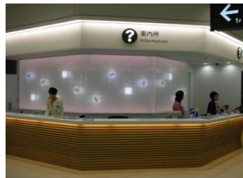
←2층 입국장에 있는 안내소 일본어, 영어, 한국어 등으로 대응 가능합니다.