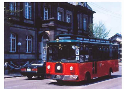
오타루의 관광투어를 달리는 버스