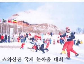
쇼와신잔 국제 눈싸움 대회

홋카이도에서는 눈싸움도 '스포츠'입니다. 북쪽지방에서 오래전부터 즐거운 놀이인 눈싸움을 정식 겨울 스포츠로 정립한 국제적인 눈의 제전, 쇼와신잔(昭和新山) 국제 눈싸움 대회. 각 지역 예선을 통과한 정예팀이 매년 2월 하순 토, 일요일에 대지의 숨소리가 살아있는 쇼와신잔 산록에서 뜨거운 열전을 벌입니다.