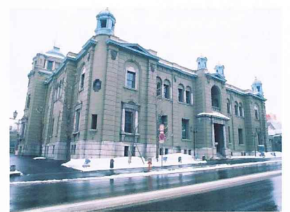
일본은행 구 오타루지점 (금융자료관)

곤니치와(안녕하세요!) 이번 달은 여러분께 동화의 나라 오타루시를 소개해드립니다. 한국 여러분께는 영화 '러브레터'나 드라마 '소금인형'(2007) '달콤한 인생'(2008), 다수의 뮤직비디오, CF 등의 배경으로 알려진 오타루. 오타루는 일본인에게도 이국정서가 넘치는 역사와 로맨스의 도시입니다. 과거 청어잡이로 부흥해 홋카이도의 중심지가 되어 금융기관이 도심에 집중되고 '북녘의 웰스트리트'라고 불릴 정도로 영화를 누렸던 도시. 지금도 시내에는 유럽형 석조 건물이나 오래된 일본 건축물 등이 남아 있습니다. 또한 주요산업이 관광업인 만큼 공예품(도예, 유리가공, 오르골) 등의 예쁜 가게가 펼쳐지는 메르헨(동화) 교차로 일대는 물론이고, 오타루의 얼굴이라 할 수 있는 운하에는 낮에는 오래된 석조 창고들을 배경으로 한 풍경이, 밤에는 등불이 점등되어 로맨틱한 분위기가 연출되어 봄·여름·가을·겨울 사계절 모두 따뜻하고 온화한 표정으로 수많은 국내외 관광객을 맞이하고 있습니다.