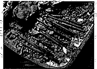
化石のクリーニングに使う道具