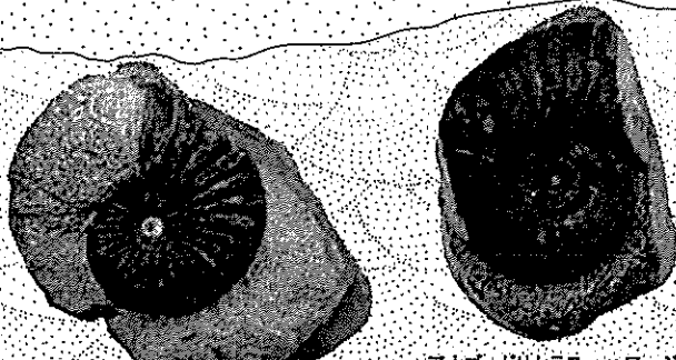
オキトロピドセラスの一種 ( Oxytropidoceras sp.)