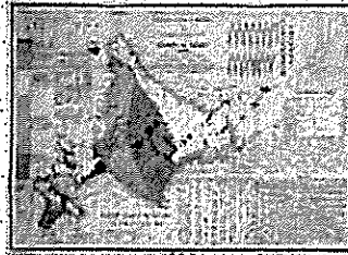
「日本蝦夷地質要略之圖」 北海道大学附属図書館蔵