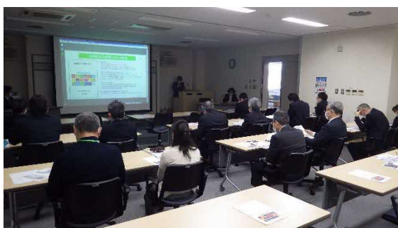
（道からのSDG sに関する説明）