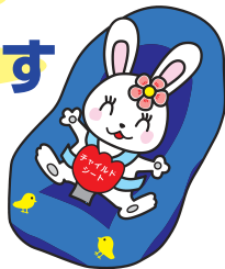
チャイルドシート着用推進シンボルマーク「カチャビヨン」