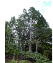
ヒノキアスナロ(ヒバ)が生育している北限の森林