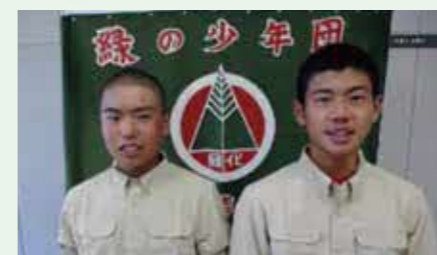
吉賀中 緑の少年団(島根県)