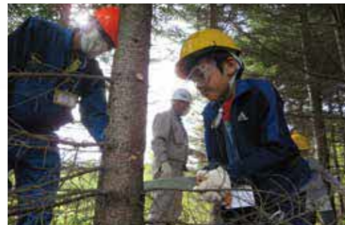
野幌森林公園育樹体験 (令和2年9月)