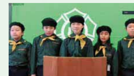
日吉みどりの少年団(愛媛県)