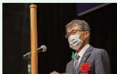
札幌市建設局長 佐々木 康之