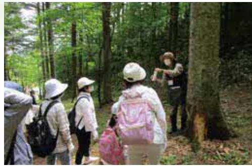
オホーツク森林体験バスツアー (令和3年7月)