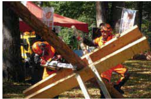
銀河の里「ツリーフェスティバル2019 in ほんべつ」 (令和元年10月)