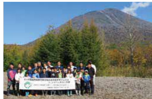
道央圏域木育フェスタ in しりべしみらいの森 (令和元年10月)