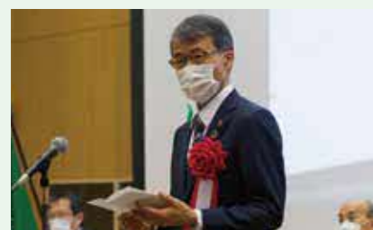
札幌市建設局長 佐々木 康之