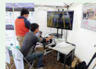
高性能林業機械シミュレーターの体験