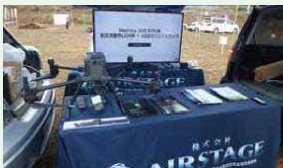
ドローン(UAV)の展示・実演