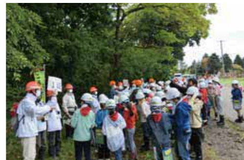
石狩市立緑苑台小学校森林教室 (令和2年10月)