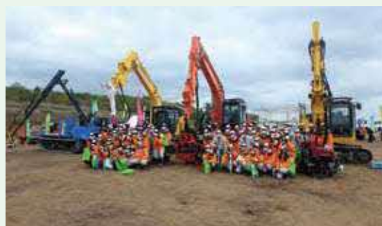
林業関係の学生による視察