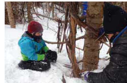
みんなで森を育てましょう! 「つる切り・枝落とし活動」 (令和3年3月)