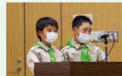
中野方小学校みどりの少年団(岐阜県)