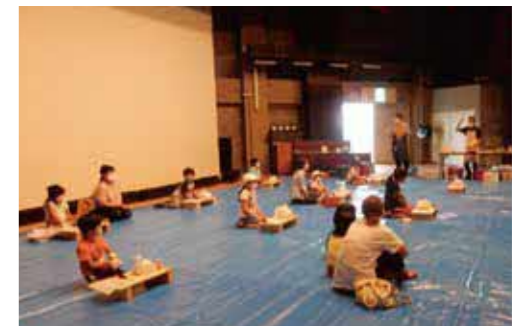
公民館講座「木育ひろば」 (令和3年8月)