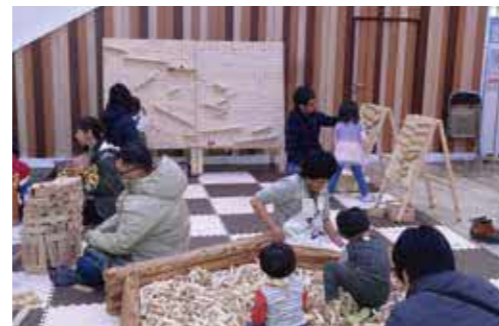
ようこそ! 森のコミュニティーセンターへ 「苔・和みの森 木で遊ぼう! 木で作ろう!」 (令和元年11月)