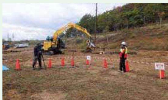
北海道スマート林業の紹介