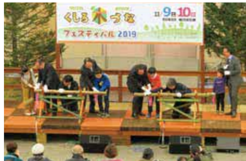
くしろ「木づな」フェスティバル2019 (令和元年11月)