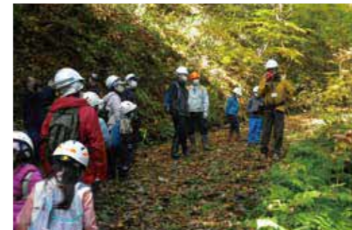
木育フェスタ in あっさぶ (令和2年10月)