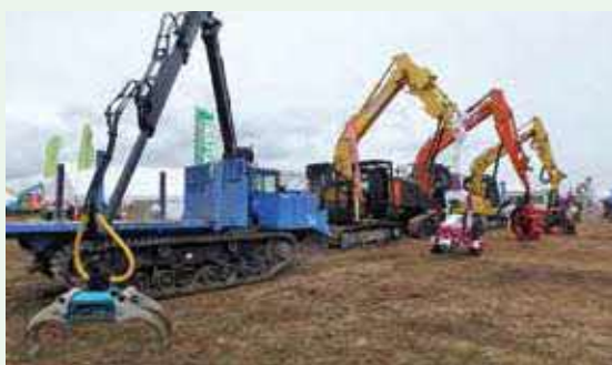
北海道における一連の施業システム紹介