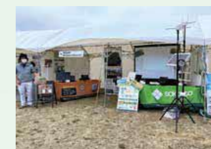
丸太検知アプリ等の展示・販売