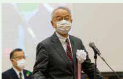
北海道副知事 土屋 俊亮