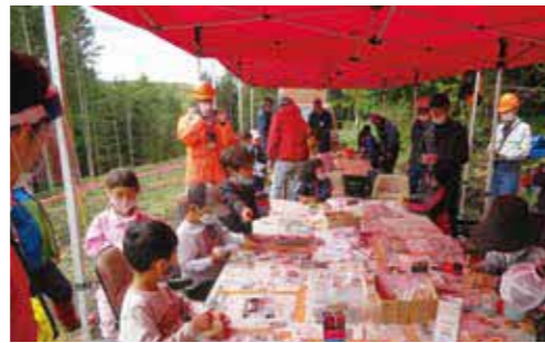
十勝圏域木育フェスタ in 久保の森 (令和2年9月)