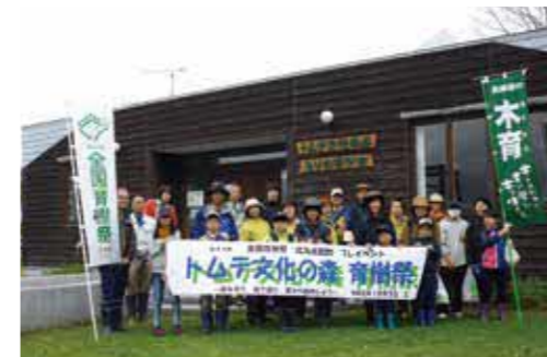
「トムテ文化の森」育樹祭 (令和元年10月)