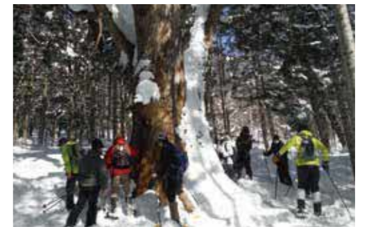
スノーシューで森林散策 (令和3年2月)