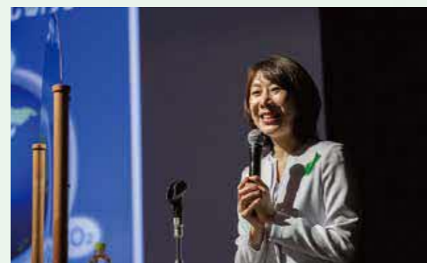
気象予報士/気象キャスター/防災士 菅井 貴子