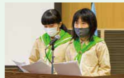
ながめま緑の少年団(北海道)