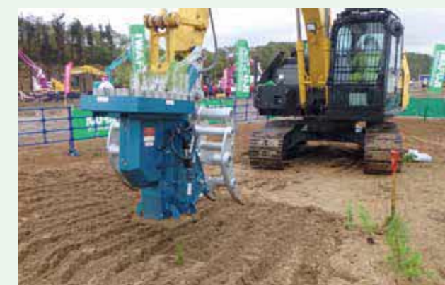
植栽(コンテナ苗自動植付機)