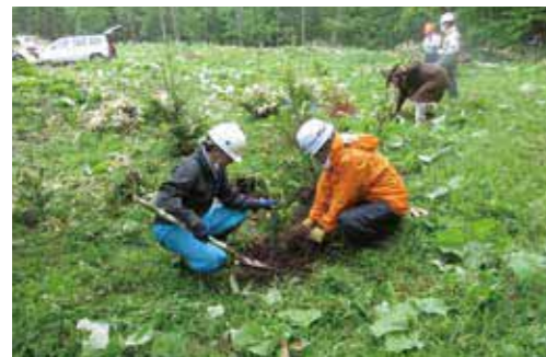
プログレス日高の森植樹事業 (令和2年6月)