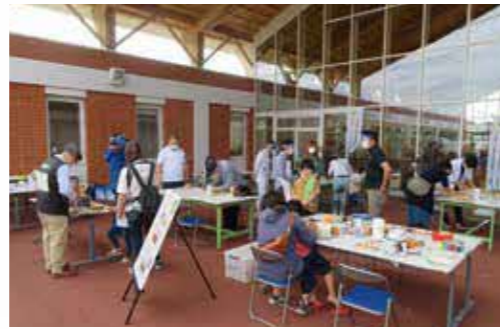
木工体験 in オータムフェスティバル 秋の流水公園まつり (令和2年9月)