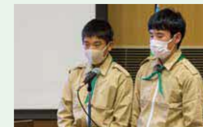
岡崎市額田みどりの少年団(愛知県)