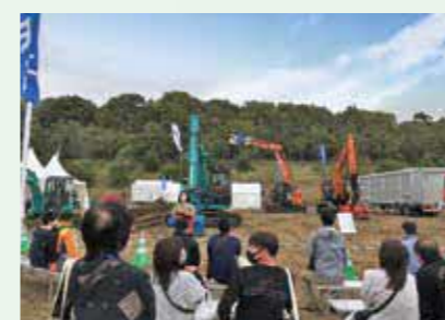
実演ブースの様子