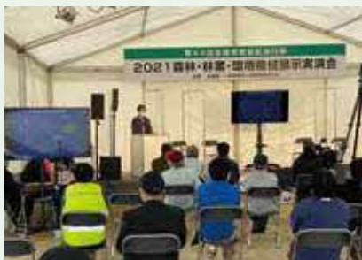
林業経営力向上セミナー