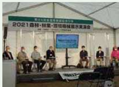
林業のスマート化フォーラム