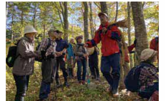
殿様街道探訪ウォーク in 秋 並びにブナの森100年観察林観察会 (令和元年10月)