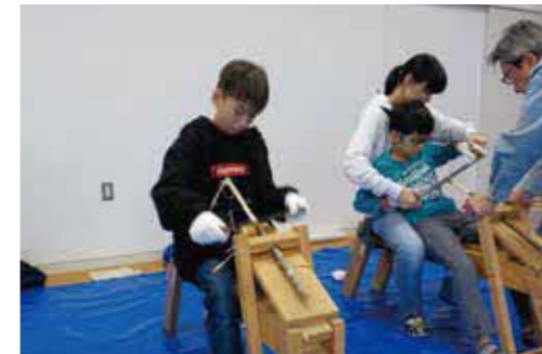
食育 & 木育体験バスツアー「森を楽しもう」 (令和元年10月)