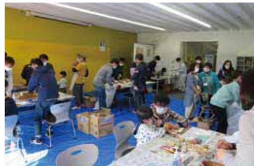
木材(地域材)利用を考える フォーラム2020「木育木工教室」 (令和2年10月)