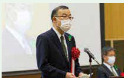
林野庁長官 天羽 隆