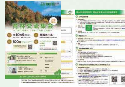
育林交流集会チラシ