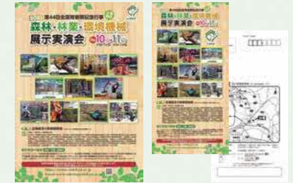
森林・林業・環境機械展示実演会 ポスター・ポストカード