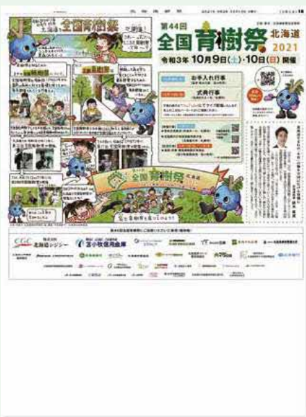
北海道新聞特集広告(令和3年10月10日、見開き2面)