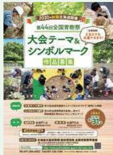
大会テーマ等募集チラシ