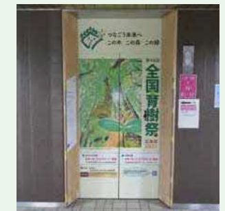
北海道庁1階(令和3年7月～10月)