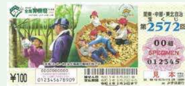
関東・中部・東北を中心に 販売された宝くじで大会をPR (令和3年7月～8月)