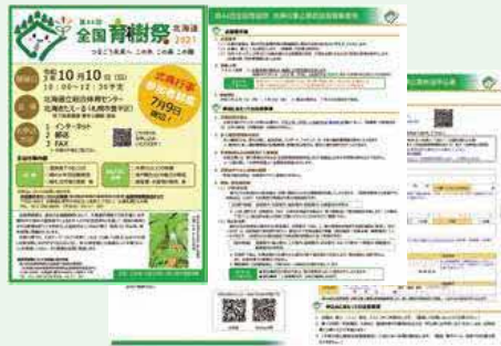
式典参加者募集チラシ