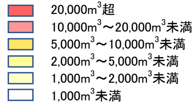
市町村別林地未利用材発生量(推計)