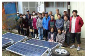
東日本大震災での 太陽光パネル設置ボランティア