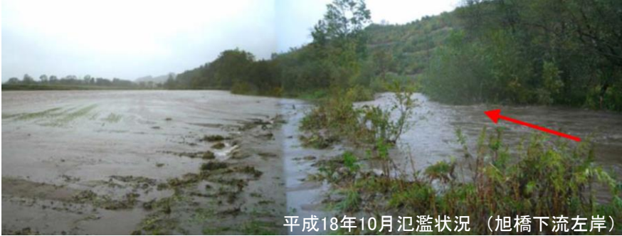
平成18年10月氾濫状況（旭橋下流左岸）