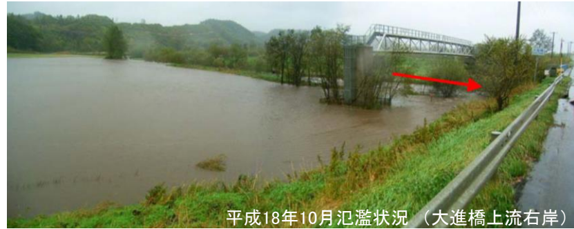
平成18年10月氾濫状況（大進橋上流右岸）