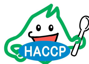
認証マーク 「ハサップくん」

食品の製造・加工・調理販売施設において、HACCPによる自主衛生管理が適切に行われているかどうかを審査し、道が定める基準に達しているものを認証する制度です。認証された食品には、認証マーク「ハサップくん」を表示することができるほか、「北海道HACCP」webページや認証食品のガイドブックで施設名、食品等を紹介しています。