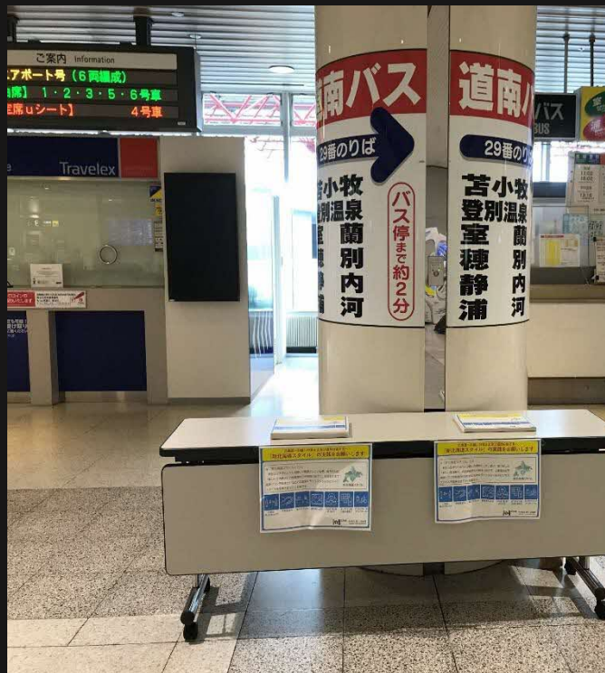
「チラシ」と「デジタルサイネージ」(新千歳空港)

■実施箇所は、「新千歳空港ほか道内各空港」、「小樽・苫小牧・室蘭・函館の各港フェリーターミナル」、「新幹線の新函館北斗・木古内駅」、「道内バスターミナル」等