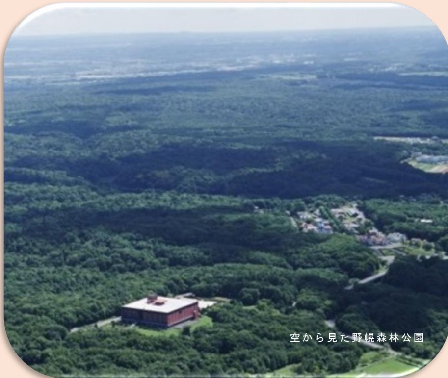
空から見た野幌森林公園

多くの人たちの労苦と知恵とチャレンジ精神によって築かれてきた北海道。先人に学び、感謝しながら、私たちは北海道への想いを次代へとバトンタッチしていきます。世界のどこにも例のない、北の大地の歴史と文化と自然。その素晴らしい価値を、広く、深く伝えながらさらに創造していきます。