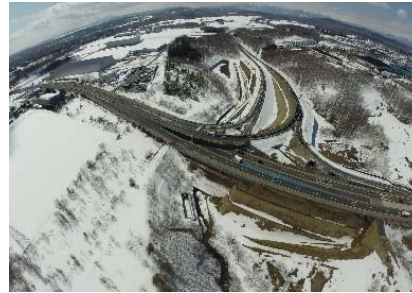
【仁別大曲線 H29.3.30全線供用開始】