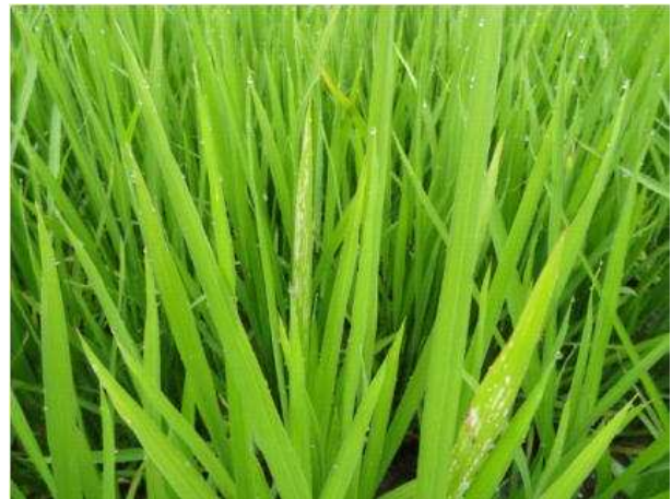
食害痕は軽微である (撮影日：7月23日)