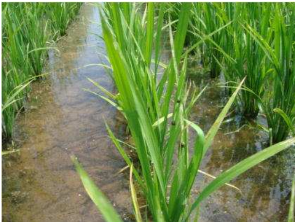
食害痕はあるが、幼虫が寄生している株はわずか (撮影日：7月4日)