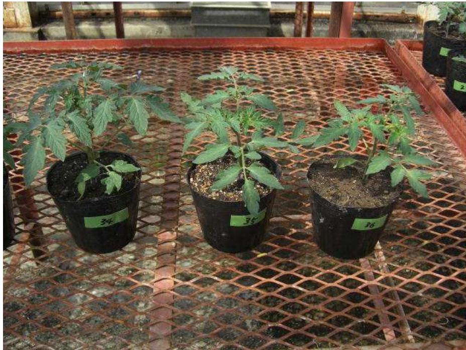
改良された育苗培土によるトマト苗