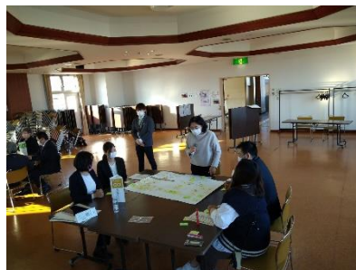
（ワークショップ結果の発表）