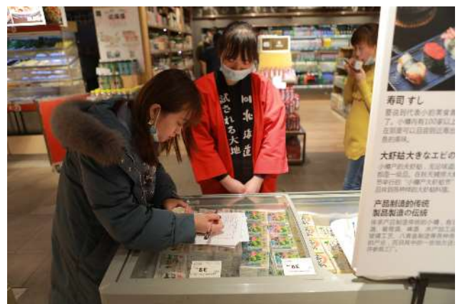
消費者アンケート