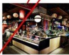
拉面、寿司、刺身、飯团