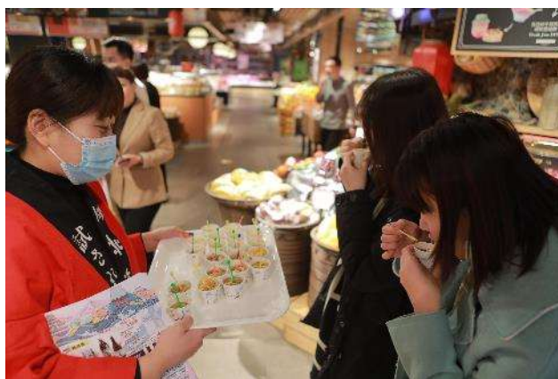
試食（インスタントラーメン）