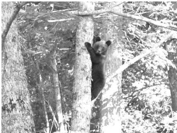
■木に登った子グマ