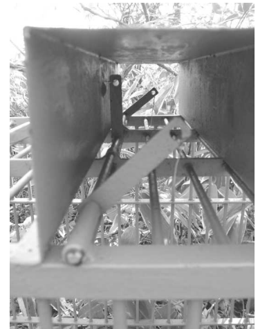
ワイヤー連結部の金具