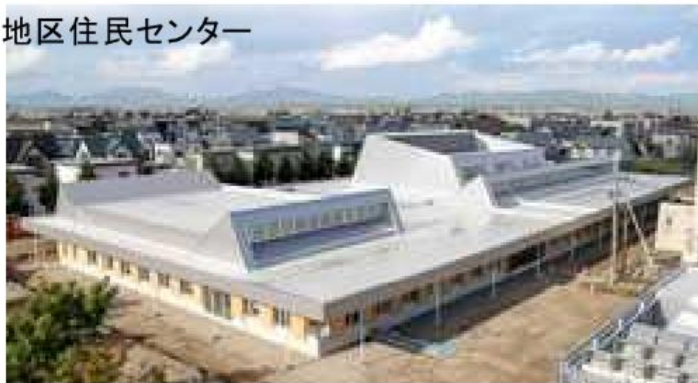
鷹栖地区住民センター