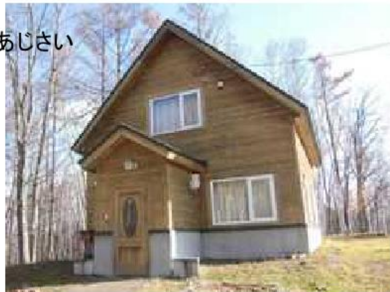
ゲストハウスあじさい

(注2)上記合計額のほか飲食費、日常生活に係る消耗品費および交通費は利用者負担となります。