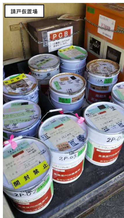
安定器の保管(ペール缶)