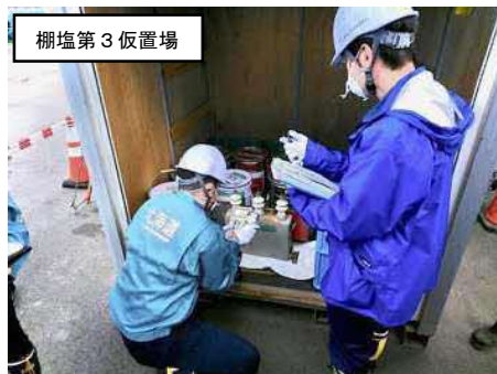
職員による表面汚染密度の測定