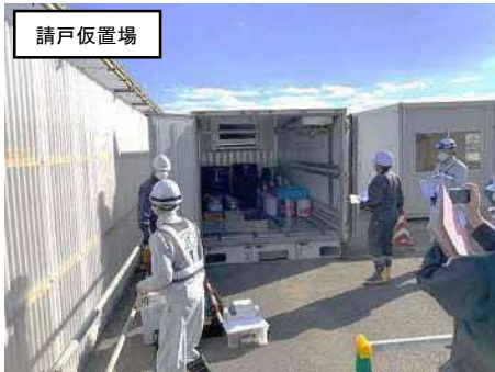
仮置場内の保管場所