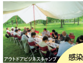
アウトドアビジネスキャンプ

広大な土地があり、大都市圏と比較し人口も少ない北海道は、社会的距離を確保しやすく、感染防止対策を取りながら、快適に働くことができる地域です。