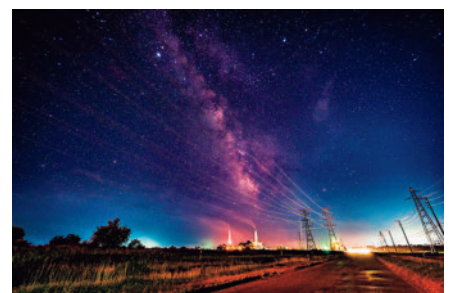
株式会社苫東「フォトコンテスト入賞写真」