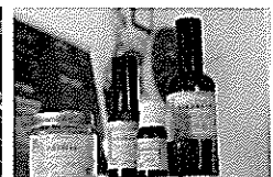
トドマツ精油商品