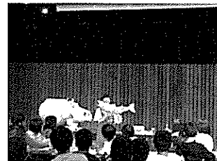
ニセコ小学校での木育活動