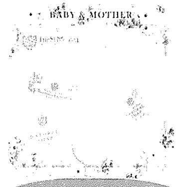
「BABY & MOTHERシリーズ」 (セントモニカ)