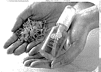
「カレンデュラ手づみオイル」 (ナチュラルアイランド・ ナチュラルサイエンス北海道支店)

感染防止対策を十分に行い開催します！ 掲載している以外にも色々な商品を用意してお待ちしています♪ 販売商品やお得な情報は裏面に掲載していますのでご覧ください！