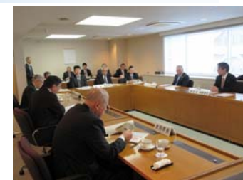
北海道市長会での意見交換 (2/1～札幌市_北海道自治会館)

北海道市長会（第1回理事会）が2/1に開催され、出席された8名の市長と、“強靱化計画と防災計画との違い”や“地域強靱化を推進するメリット”などの意見交換も行いました。「国土強靱化地域計画に基づき実施される取組への国の支援」について質問があり、関係9府省庁所管の29の交付金・補助金で、「交付の判断にあたって一定程度配慮されるなどの支援が講じられる」ことについて説明しました。