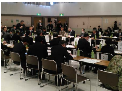
地域防災力向上に向けた意見交換会 (12/20～北見市_端野町公民館)

災害に強い地域づくりの取組を推進するための意見交換会が12/20、北見市で開催（主催：北海道開発局）され、オホーツク内陸地域の10市町村をはじめ、国土地理院、気象台、自衛隊、北海道など各関係機関が集まり、地域の課題や具体的な取組事例について話し合われました。「議題①災害時の体制構築」では、災害時の円滑な初動体制の構築を目的としたタイムラインの作成（訓子府町）、職員が常時、携帯できる初動対応カードの作成（美幌町）などの事例発表がありました。「議題②住民避難」では、各自治体に判断が委ねられている避難勧告等の発令について、発令するタイミングの難しさや、発令しても被害がなかった場合、住民の危機意識が低下しがちになるなどの課題が挙げられました。