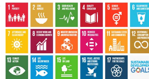
持続可能な開発目標SDGs 17の目標

また、社会が急速にグローバル化する中、地球環境や経済活動、人々の暮らしなどの持続可能な発展を目的に国連で採択された「持続可能な開発目標（SDGs）」を計画推進の念頭に置き、施策を進めるべきとのご意見もありました。道強靱化計画の中でもSDGsの要素を最大限反映し、SDGsの目標の達成に向けて、関連する施策を積極的に推進していきます。