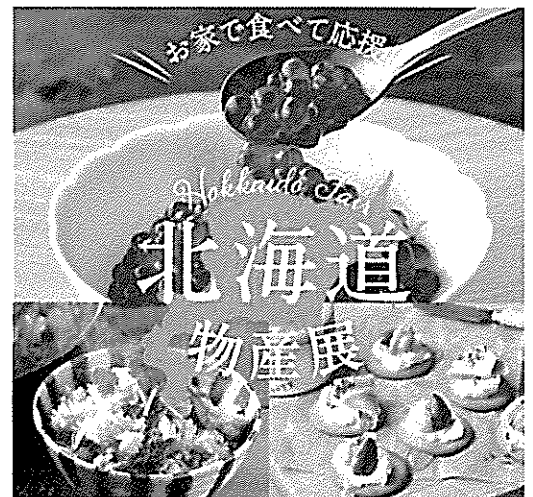
▲「お家で食べて応援！北海道物産展」 サイトイメージ