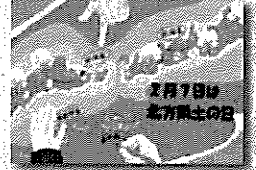
2019年度 最優秀作品 (中学生)