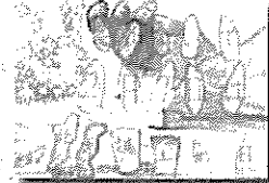
2019年度 優秀作品 (小学生)