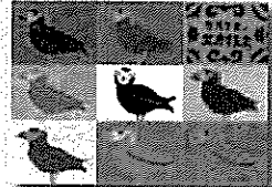
2019年度 優秀作品 (中学生)