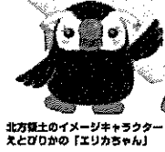
北方領土のイメージキャラクター スエとびりかの「エリカちゃん」

2月7日は「北方領土の日」です。道内の中学生を対象に作文を、小・中学生を対象に啓発資料の図案などで活用する図画作品を募集します。