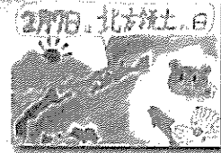
2019年度 最優秀作品 (小学生)