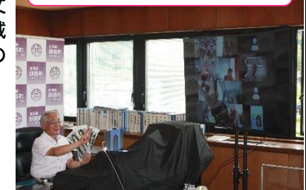
釧路町長とふるさと応援団員のオンライン会議の様子