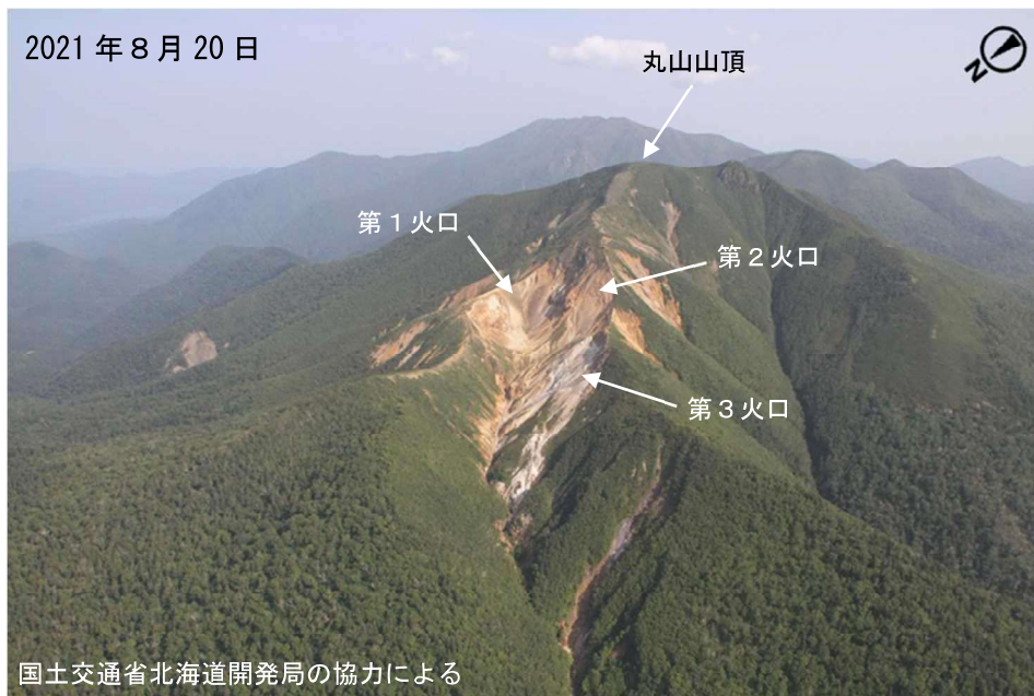
図2 丸山 北西斜面に位置する火口列の状況 北西側上空（図1の①）から撮影