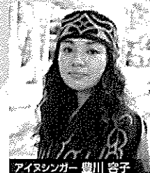
アイヌシンガー 豊川 容子