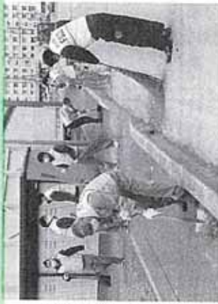
約20人が参加し道路をきれいに清掃した

道産樹木のサボト企業に登録している同社は、地域貢献活動の一環として北の散歩道清掃に取り組んでいる。前年度は新型コロナウイルス感染症の状況を踏まえ中止したが、今回はマスク着用による対策を講じた上で実施。21回目の活動となった。4月28日、同社が本年度に新しく作業服を蓄用した参加者は、火ばさみを使ってたばこの吸い殻や木の枝などを散らしたごみを丁寧に回収した。橋本社長は「お世話に