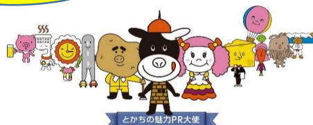
とがちの魅力PR大使