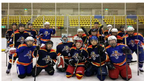
建設管理部でのアイスホッケー大会

帯広はおいしい食べ物ばかりデブ!!夜の街も楽しいデブよ!!コロナがいち早く終息したらたくさん街に行きたいデブー。ㇿ