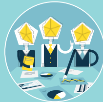
ワークショップ型

EdTech(テクノロジーを活用した教育技法)を活用し、時間や場所にとらわれない多様な学びのスタイルを提供します。※講義形式でのワークショップも選択できます。受講者の環境・状況に合わせた学習が可能です。