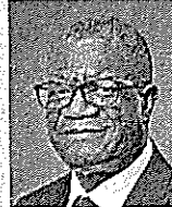
デニ・ムクウェゲ 2018年ノーベル平和賞受賞者