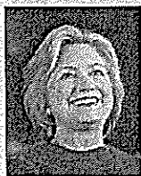
ヒラリー・クリントン 元米国防務長官 (ビデオメッセージ)