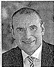
グドゥニ・トルラシウス・ヨハネソン アイスランド共和国大統領 Guðni Thorgeirsson President of the Republic of Iceland