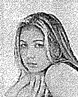
長谷川 ミラ モデル