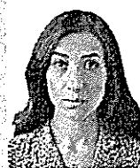
ナディア・ムラド 2018年ノーベル平和賞受賞者