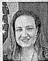
カトリーナ・フォトバット 米国際労働局グローバル女性問題局長